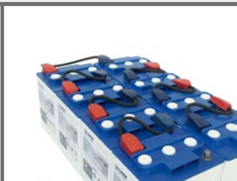
Set afneembare batterijen (versie 200E)