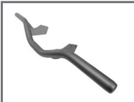
Bull-bar vooraan als bescherming