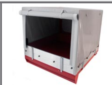
Afdekezel voor de laadbak dat langs 3 zijden kan geopend worden