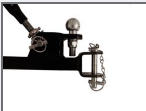
Dubbele trekhaak voor caravans/aanhangwagens *