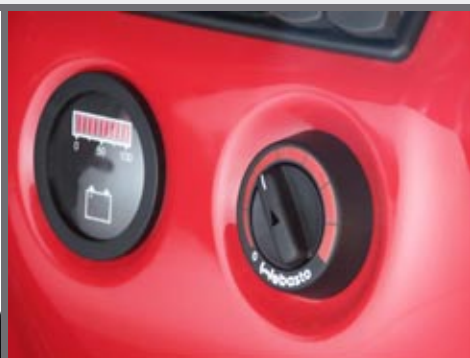
Standaardverwarming (versie D en Dk) of met Webasto systeem (versie E)