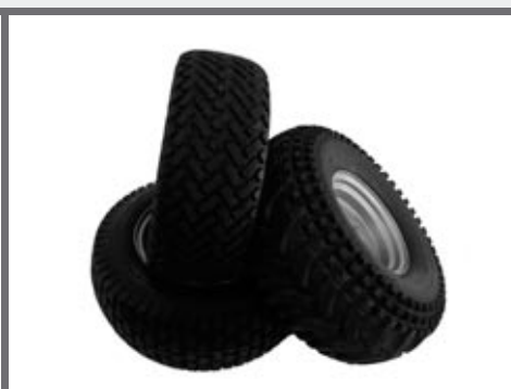
Banden voor alle terrein, voor tuin en voor stad