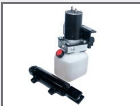
Elektrohydraulisch kippen van de laadbak