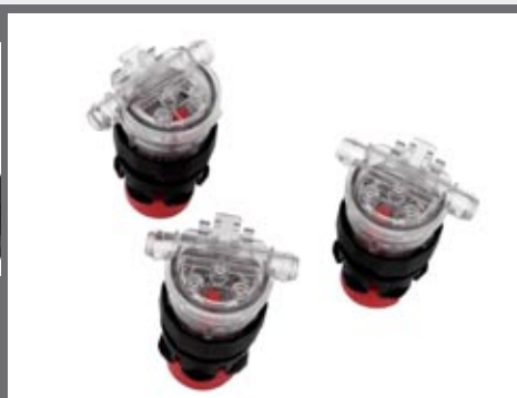
Automatisch vulsysteem voor aandrijfbatterijen (versie E)