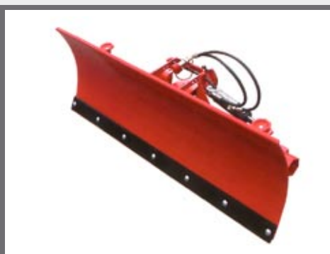
Blad voor sneeuwruimen