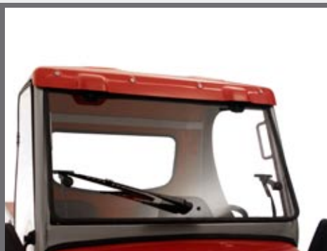
Semi-cabine/cabine met deuren