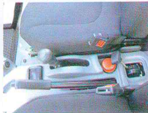
Tussen de stoelen zit de handrem met daarnaast een ronde pook voor de hoge en lage gearing.