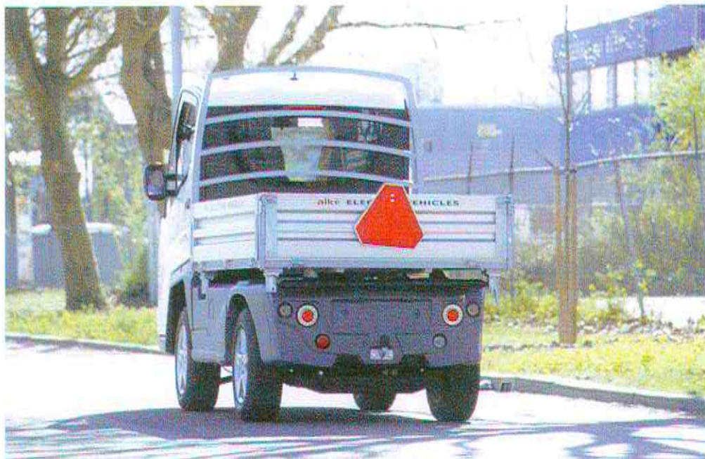
De XT is 143 cm breed en kan ook als langzaamverkeer zonder kenteken de weg op. Je mag dan officieel niet zo hard, maar wel meer trekken, namelijk 3 ton voor de zwd.

Snel rijden over een betonpad was niet heel aangenaam. De bobbels klaptten in de rug. Dit kwam door de luchtvering. Die was bij ons model op maximaal ingesteld en reageert dan erg stug. Wanneer er 1.000 kg in de driezijdig kippende laadbak had gezeten, was het waarschijnlijk aangenamer geweest. De luchtvering had overigens ook tijdens het rijden veranderd kunnen worden met een tuimelschakelaar. Je kunt de vering namelijk