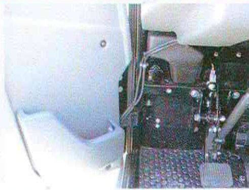
Het scharnier van de deur is beveiligd met een band, zodat de deur niet door de scharnier kan slaan.