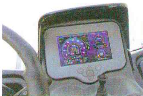
Het display met ampèremeter, 'brandstofmeter' en snelheidsmeter met toerenteller. Het joystickje is voor de rijrichting.