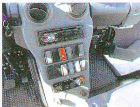
Helemaal links onder op het middenconsole zit een draaiknop voor de vier rijmodussen: eco, sport, towing en climbing.